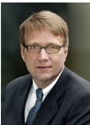
CDU-Generalsekretär Ronald Pofalla